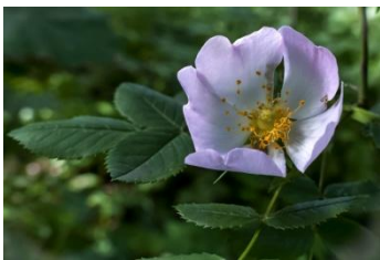
ex : AT églantier .jpg

Légende de l'image : AT ( andré tab...) + titre court