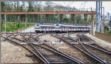
Gilles LE GALL