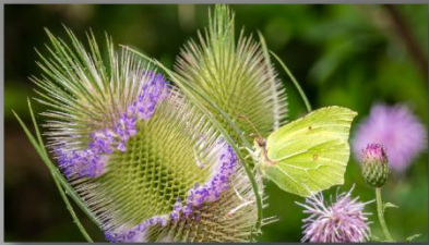
Gilles LE GALL