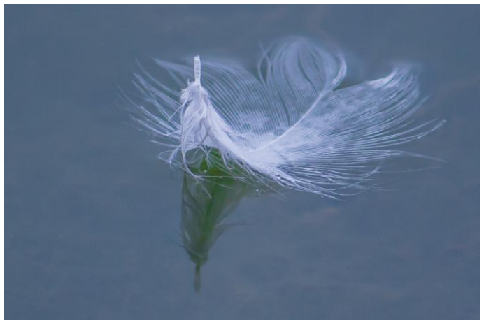
Gilles Le Gall